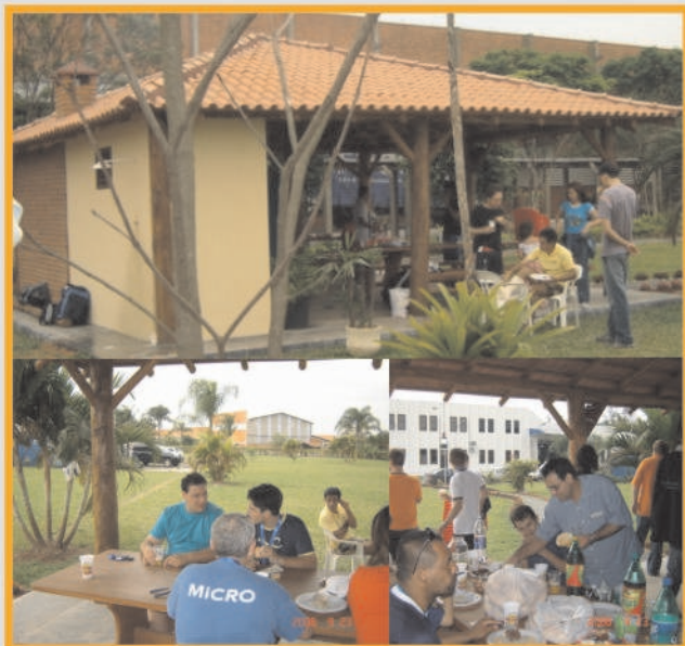
Quiosque Faça a sua reserva com Kíria.

Lembrando que os funcionários podem contar com a área de lazer localizada nas dependências da empresa.